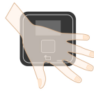
Держать руку под углом (ограничение по углу вращения не более 90 градусов)