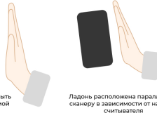
Ладонь расположена параллельно сканеру в зависимости от наклона считывателя